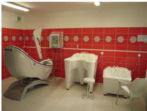
hygienické středisko Krejčího

V loňském roce se nám v dobré spolupráci s naším zřizovatelem Statutárním městem Liberec podařilo zrekonstruovat a rozšířit zázemí pro poskytování těchto služeb, např. jsme zrekonstruovali prádelnu, hygienické stanice v jednotlivých domech s pečovatelskou službou, zřídili ambulanci fyzioterapie, domácí péče a zařídili kadeřnický koutek.