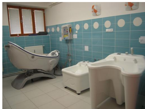
hygienické středisko Borový vrch