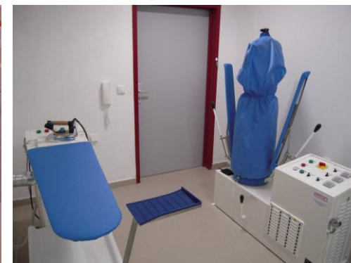
nové vybavení prádelny