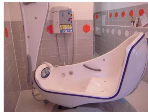
hygienické středisko Burianova 969