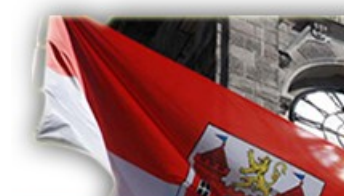
Oficiální stránky statutárního