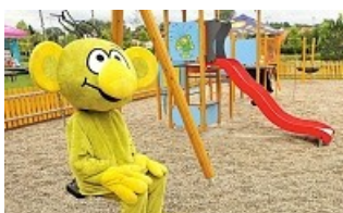
HLASUJTE PRO HŘIŠTĚ