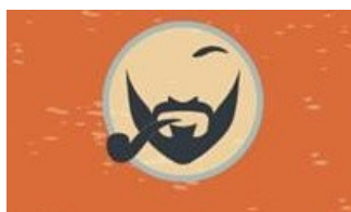
PLES PRIMÁTORA 2016