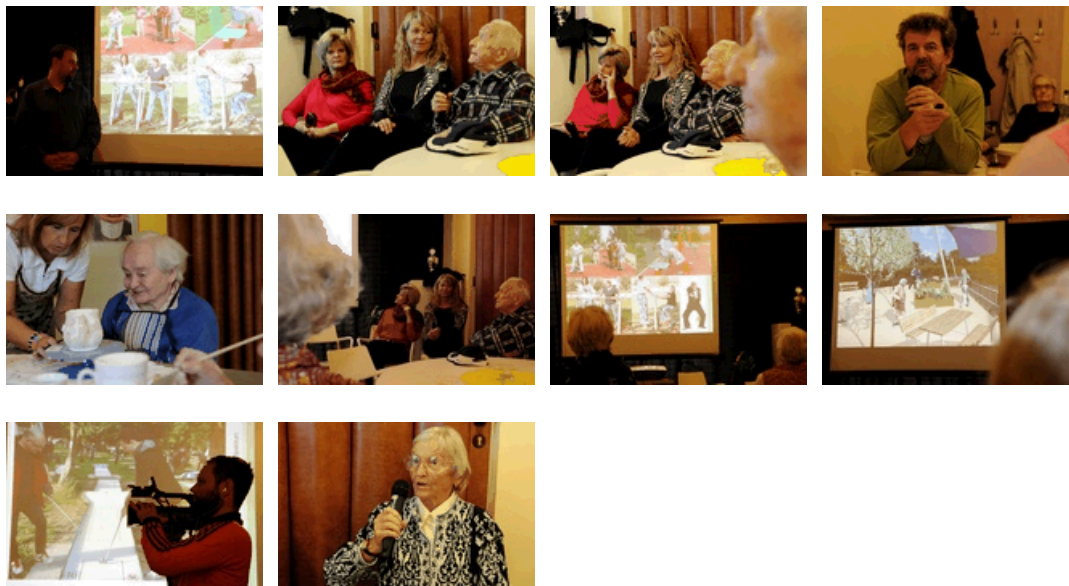
Celkový počet obrázků v galerii: 10