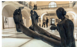
AKCE NA VÍKEND