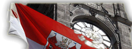
Oficiální stránky statutárního města Liberec