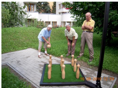
ruské kuželky DPS Borový vrch