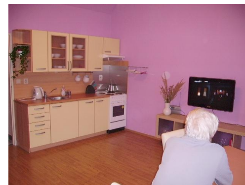
pobytová a ambulantní odlehčovací služba