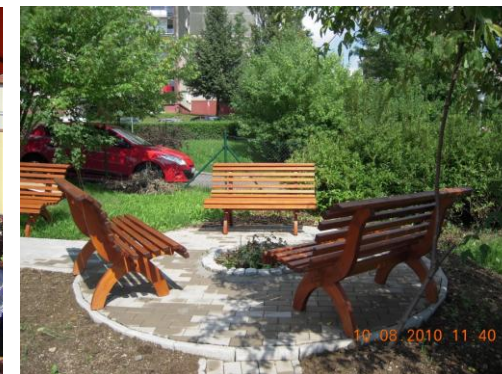
zahrada DPS Burianova