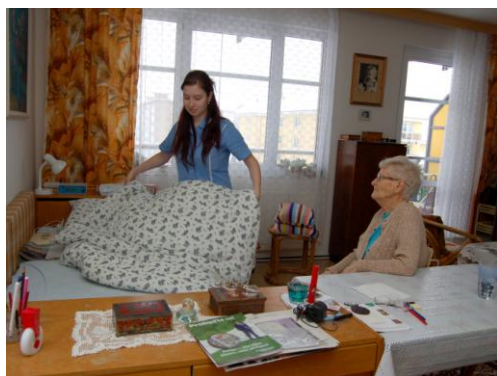
terénní pečovatelská služba

Poskytování sociální a zdravotní péče na velmi dobré úrovni je pro naši organizaci samozřejmostí, dále se ve spolupráci s naším zřizovatelem statutárním městem Liberec úspěšně snažíme zajišťovat podmínky pro aktivní náplň volného času našich klientů v domech s pečovatelskou službou.