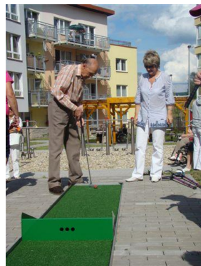
minigolf, herní prvky, pergola a terasa DPS Krejčího